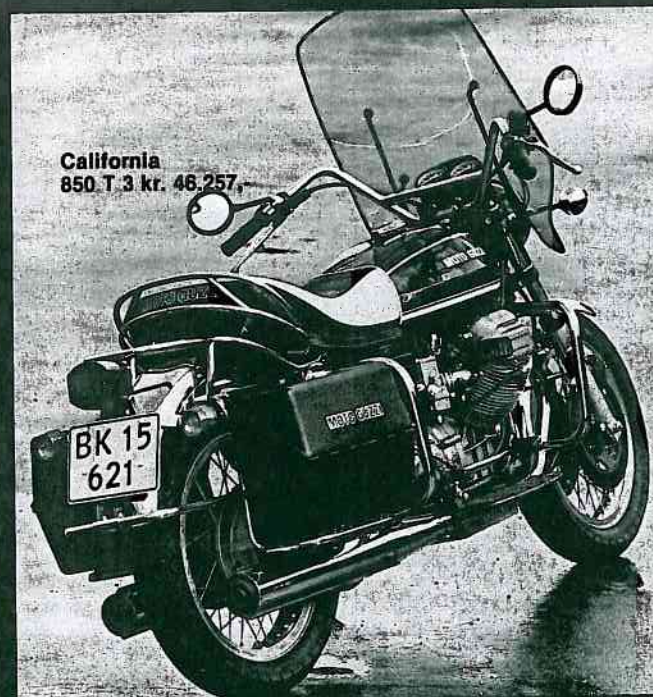
California 850 T 3 kr. 46.257,-