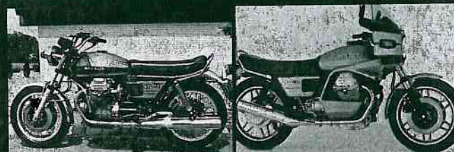
850 T 3 kr. 40.531,-